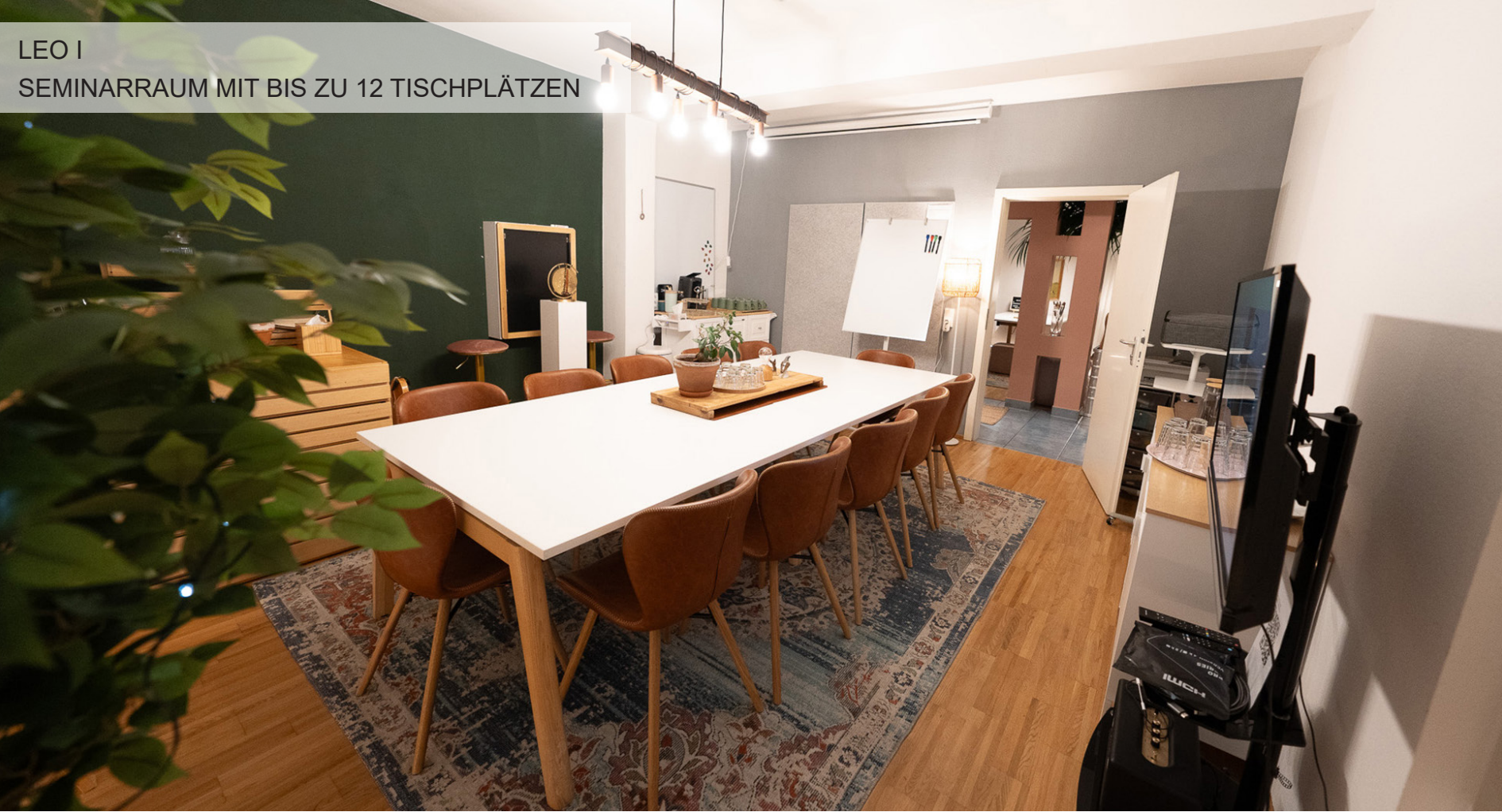
LEO I SEMINARRAUM MIT BIS ZU 12 TISCHPLÄTZEN